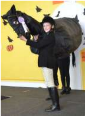
Taispeántas Gléas-éadaí na Samhna